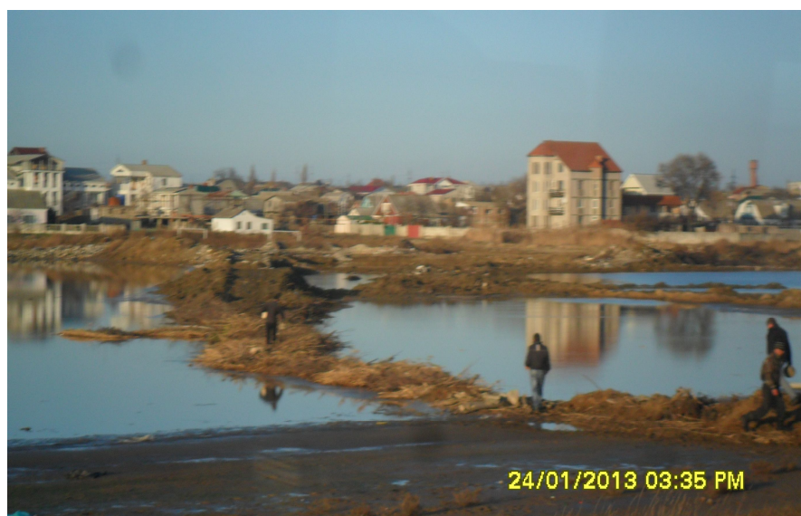
Рис. 5 Засыпка озера Адзиголь, направленная на его осушение.

По нашим оценкам, количество уничтоженной лечебной грязи составляет 5425 куб. метров. Так как плотность иловой лечебной грязи в среднем составляет 1,6 г/см 3 , то вес потерянной грязи составляет 8680000 кг, или 8680 тонн. Исходя из расчета средней стоимости иловой лечебной грязи на современном рынке 32 грн. за 1 кг потери составили 277,76 млн. грн.