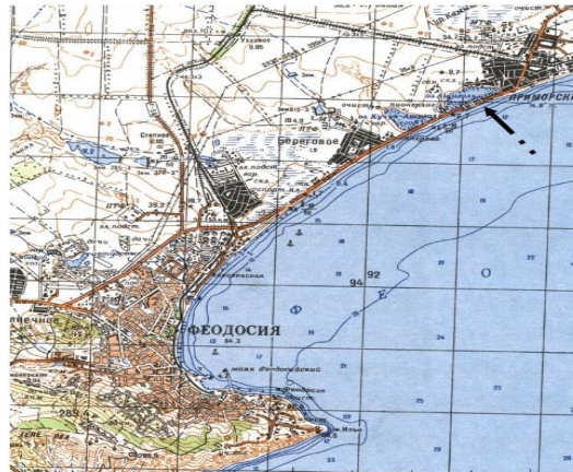
б) 1988 г.