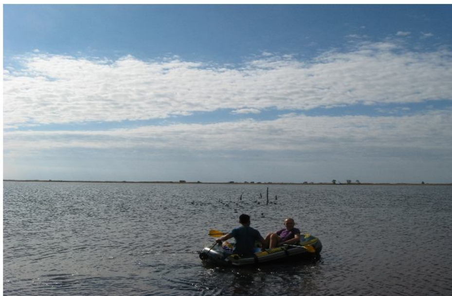
Рис. 6. Взятие проб ила и рапы озера Аджиголь (август, 2011 г.)