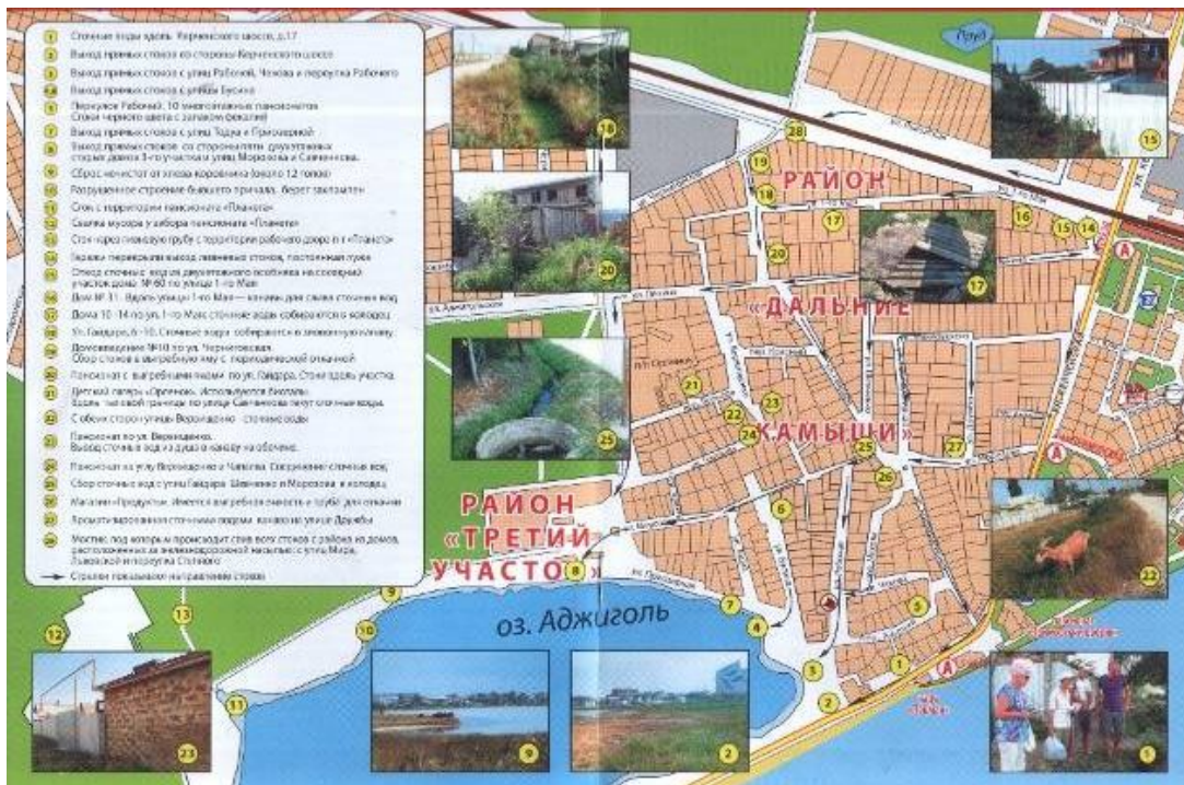
Рис. 3. Источники бытовых и канализационных стоков в озеро Аджиголь. Стрелками отмечены направления движения дренажных и сточных вод.

Основные источники загрязнения озера Аджиголь - выгребные ямы поселка Приморский (половина территории поселка не имеет канализации), стоки из которых поступают в оз. Аджиголь.