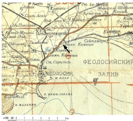
а) 1938 г.