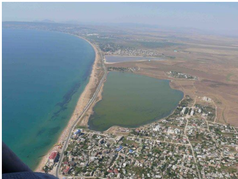
Рис. 4. Озеро Аджиголь до начала его искусственного осушения [8].

До массовой застройки района Дальних камышей и засыпки восточной части озера Аджиголь оно функционировало как природная экосистема с сохранением лечебных свойств грязи [8].