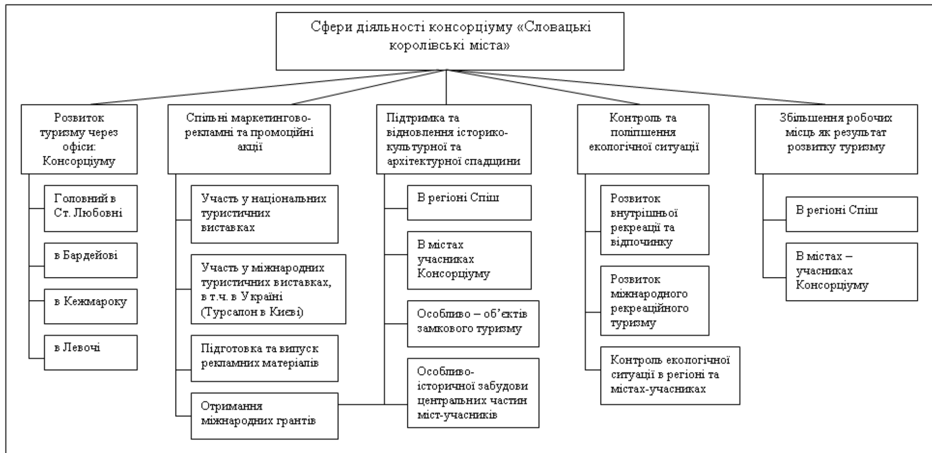
Рис. 4. Сфери діяльності консорціуму «Словацькі королівські міста» (авторська розробка за [4; 9-12])