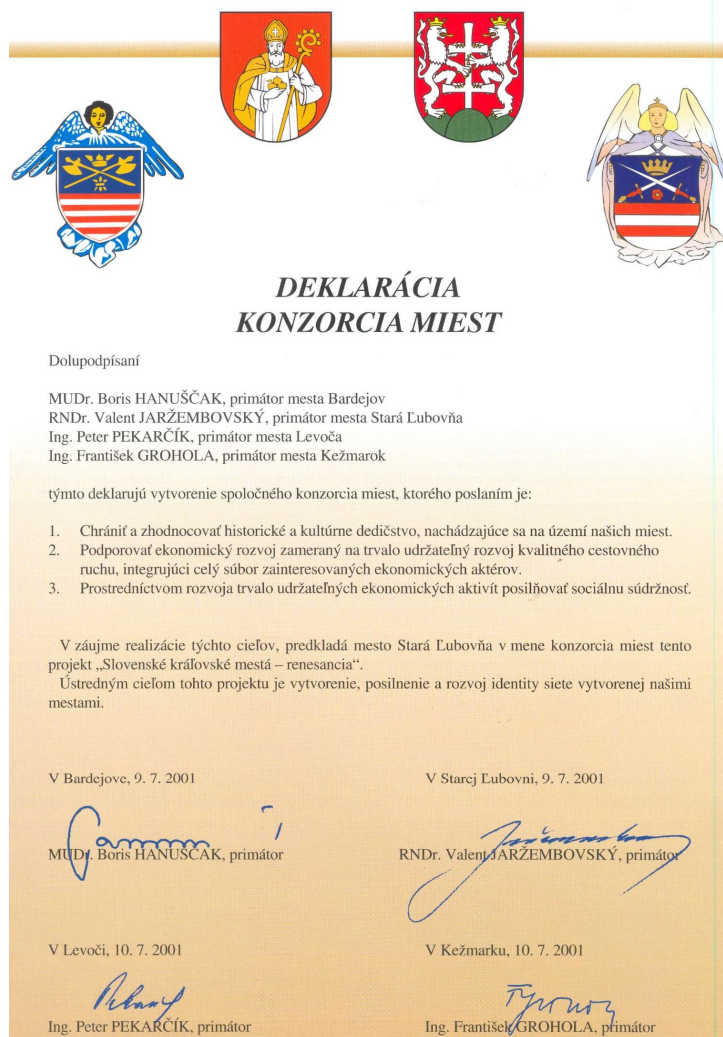
Рис. 1. Декларація про утворення Консорціуму «Словацькі королівські міста» (словацькою мовою) [4]