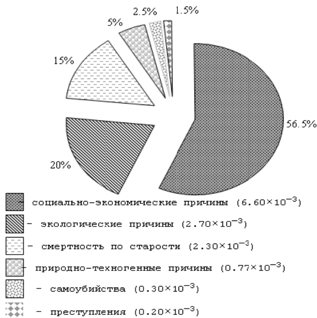
Рис. 3. Социальные риски (риски смерти) России. В скобках - количество смертей в год [2]

Вновь прибывающие в растущие города переселенцы часто вынуждены осваивать малопригодные для проживания и подверженные опасным природным процессам участки - склоны холмов, поймы рек, заболоченные и прибрежные территории. Ситуация часто усугубляется отсутствием заблаговременной инженерной подготовки и соответствующей инфраструктуры на вновь осваиваемых территориях и возведением конструктивно несовершенных зданий. Это приводит к тому, что города все чаще оказываются в центре разрушительных стихийных бедствий, где страдания и гибель людей приобретают все более массовый характер. При этом выявлена четкая