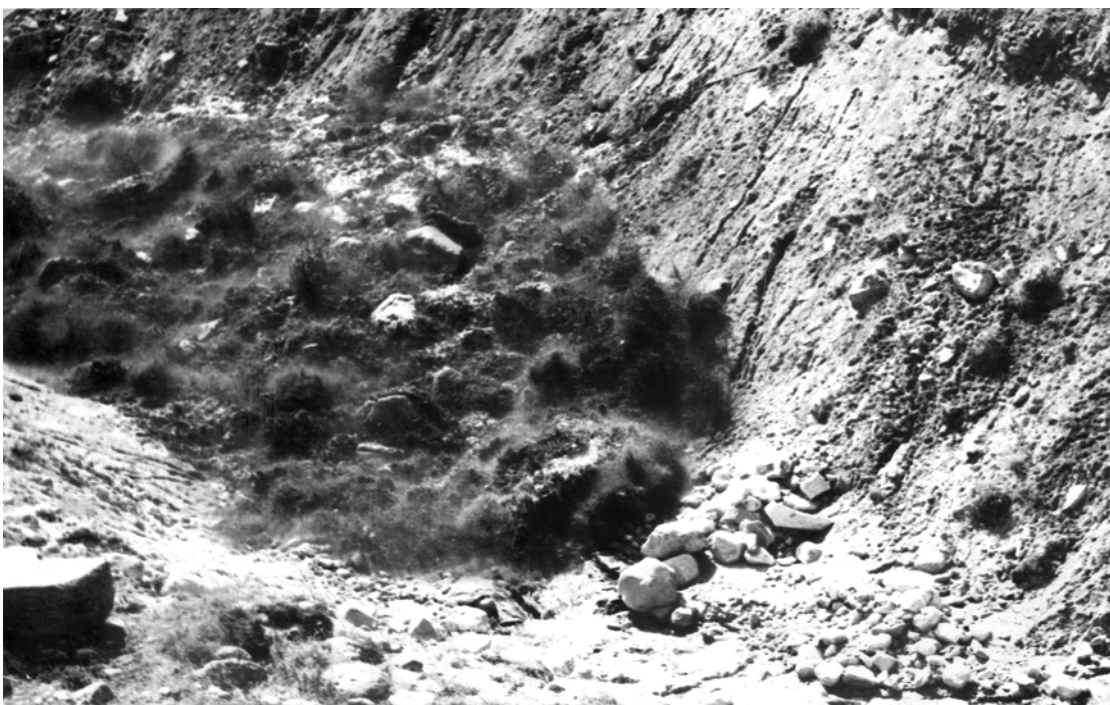
Рис.2 Селевой поток, головная часть.