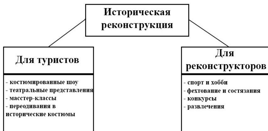
Рис. 2. Возможности реализации исторической реконструкции для разных групп Составлено автором

В программу фестиваля исторической реконструкции обязательно входит военная составляющая. Военно-исторические фестивали являются расширенной версией фестивалей реконструкции. Их главная отличительная особенность — отсутствие фиксации на определенной эпохе, а также направленность на военную составляющую истории. Крупные военно-исторические фестивали проводят своеобразный экскурс во времени и странам в рамках одного мероприятия. Их участники из разных «эпох» обычно демонстрируют свое искусство в разные дни фестиваля, объединяясь в гала-представлении финального дня. Большинство военно-исторических фестивалей проходит на территории России и сопредельных государств.