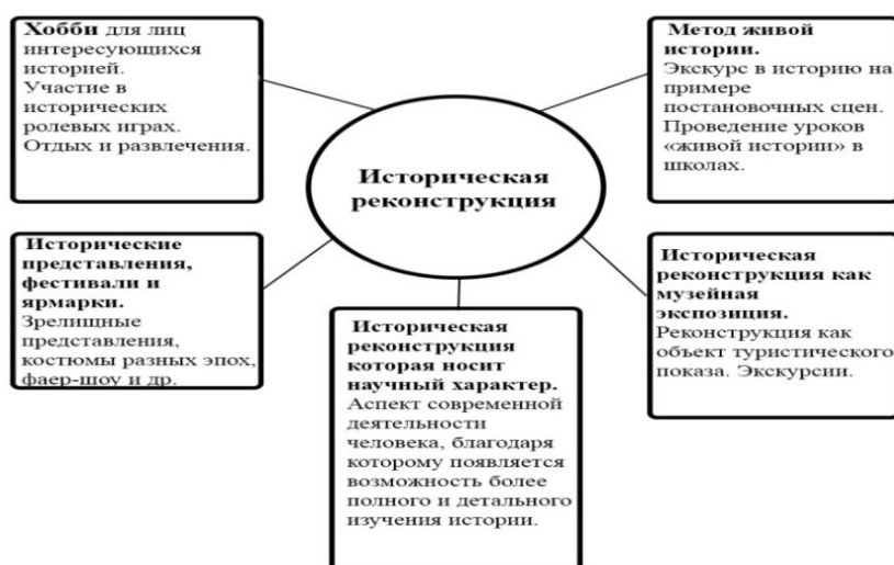
Рис. 1. Историческая реконструкция как вид событийного туризма Составлено автором

Сегодня этот вид туризма набирает всё большие обороты в своём развитии, это вызвано тем, что наблюдается тенденция повышения интереса к изучению истории, исторических личностей, событий, быта разных эпох. И как следствие, люди пытаются визуализировать и прожить исторические события путём реконструкции исторических сцен и эпизодов из жизни исторических личностей. Историческая реконструкция в своей сущности проявляется в разных формах проведения и организации, например, такие формы как фестивали, уроки живой истории, как живая музейная экспозиция или просто хобби для людей, интересующихся историей. Так как фестивали привлекают внимание своей красочностью, интересными мероприятиями, живостью выступлений, зрелищностью боёв, аутентичностью ремёсел и реконструкцией уклада быта прошлых эпох. На рисунке 1 представлена историческая реконструкция как элемент событийного туризма.