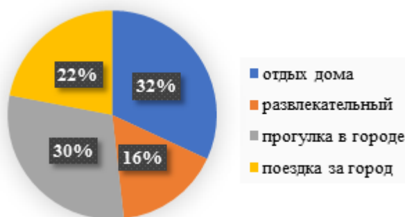
Рис. 1. Предпочтения вида отдыха в свободное время Составлено автором

Анализ рекреационных видов деятельности, которые предпочитают выбирать в свободное время молодые люди показал, что 48% отдыхают дома, 45% — совершают прогулку по городу и 33% — поездку за город (Рис. 1).