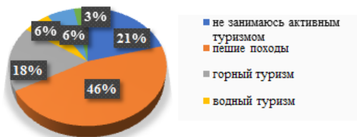
Рис. 2. Распределение ответов по предпочтению выбора активных видов туризма Составлено автором

Относительно выбора активных видов туризма ответы распределились следующим образом (Рис. 2).