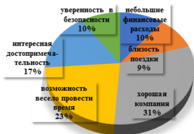
Рис. 3. Факторы, способные оказать влияние на решение совершить активную туристическую поездку.

Самыми популярными остаются пешие походы выходного дня. Они наиболее доступны, не требуют высокой подготовки и специального снаряжения, позволяют в течение дня провести время на природе и отдохнуть после похода дома в комфорте, что для многих является немаловажным, неготовностью проводить ночь в палаточных условиях. Горный туризм выбирают немногие, а водный и спелеотуризм интересен еще меньше. И как оказалось, более 20% опрошенных не проявляют интереса к активному туризму. На вопрос «Что вас сдерживает от занятий активными видами отдыха?» 28% респондентов ответили — «отсутствие компании» и 24% — «по состоянию здоровья». Не знают, куда можно поехать 18% опрошенных и у 16% отсутствует интерес к активному туризму. Среди прочих причин оказались такие, как: отсутствие свободного времени, редкая возможность выбраться в поход, недостаток финансов и снаряжения, лень. Как показывает опыт, самоорганизация у молодежи проявляется редко, что чаще всего объясняется их мотивацией. Для современной молодежи важно не пассивное восприятие информации в процессе похода или экскурсии, а активное участие в событиях. Это подтверждается ответами на другой предложенный вопрос: «Какие факторы оказывают (могут оказать) влияние на ваше решение совершить активную туристическую поездку?». Для ответа на вопрос были предложены следующие ответы (рис. 3).