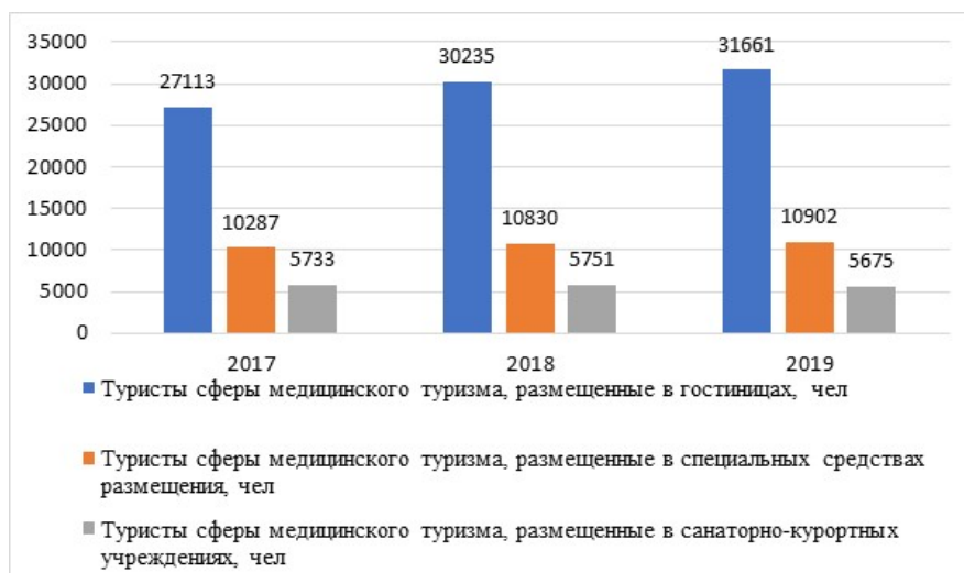
Рис. 1 Динамика туристов сферы медицинского туризма в Российской Федерации за период 2017–2019 гг.