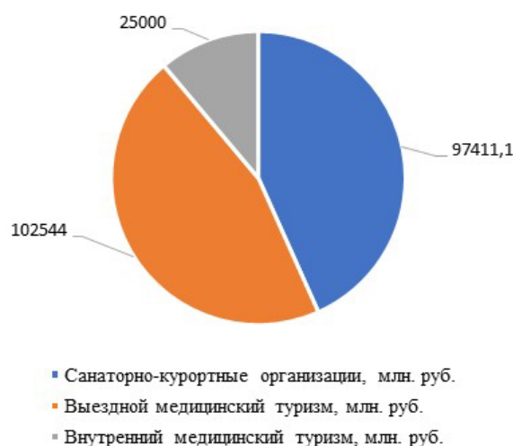
Рис. 3. Объем рынка медицинского туризма в Российской Федерации в 2019 г. Составлено по [5].

Рынок выездного медицинского туризма в Российской Федерации в 2019 г. составил 102544 млрд руб. Объем рынка внутреннего медицинского туризма в 2019 г. составил 25 млрд руб. (рис. 3).