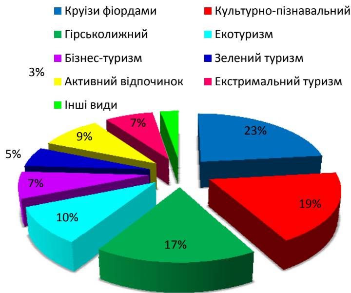
Рис. 2. Розподіл потоків за видовою структурою [4]

В багатьох країнах туризм є стратегічним напрямком для розвитку економіки, що і призвело до посилення конкуренції. Норвезькі туристи є привабливою групою для багатьох країн.