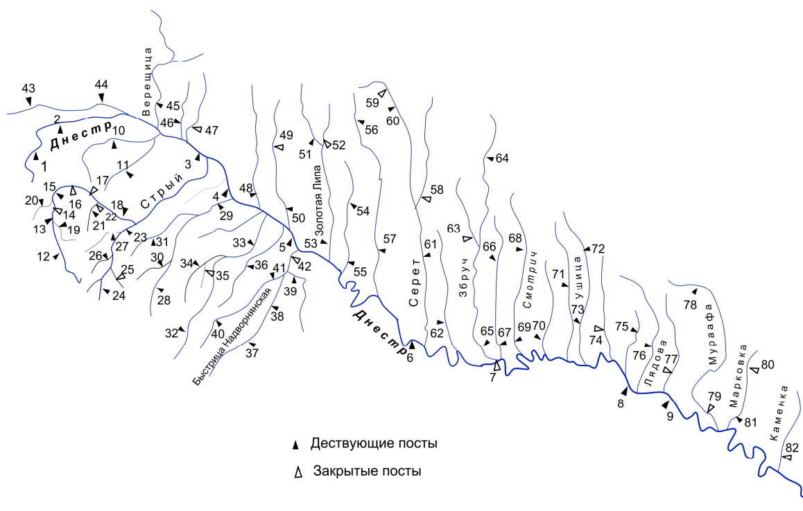
Рис. 1. Схема расположения постов наблюдений верхнего и среднего Днестра

В работе использованы данные по 82 гидрологическим постам с продолжительностью наблюдений до 2010 года включительно (рис. 1).