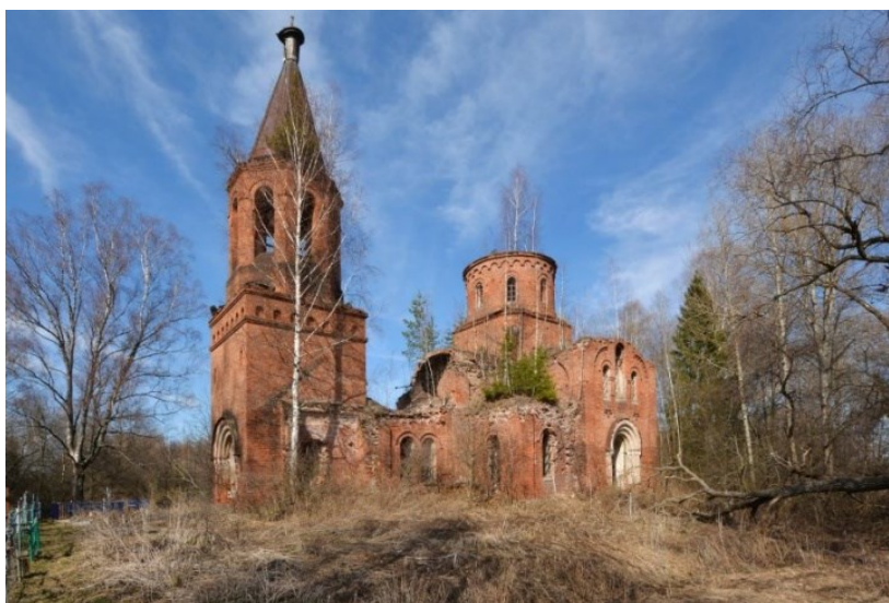
Рис. 3. Церковь Живоначальной Троицы в селе Гребенкино Медынского района Калужской области — объект, который может быть причислен к историко-культурному наследию региона.

Несмотря на богатое разнообразие видов кустарных промыслов и ремесел, и почти повсеместное их распространение в прошлом, в настоящее время можно выделить только несколько сложившихся центров традиционных промыслов и ремесел на территории Калужского края: Таруса, Малоярославец, Спас-Деменск, Думиничи. В большинстве своем, расположены эти центры в городской среде. Бывшие промысловые центры в прежнем качестве не существуют, но отдельные