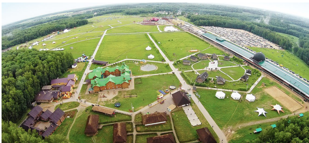
Рис. 1. Этнографический парк-музей «Этномир» в деревне Петрово Калужской области.

Существующая модель функционирования сельского туризма как «национальная деревня», особенность которой заключается в создании стилизованных под национальную специфику «агротуристских деревень», «рыбачьих деревень», «пчеловодческих хозяйств» этнографических центров и тому подобных, требует больших инвестиционных ресурсов, и осуществление таких проектов под силу только крупным предпринимателям (рис. 1).