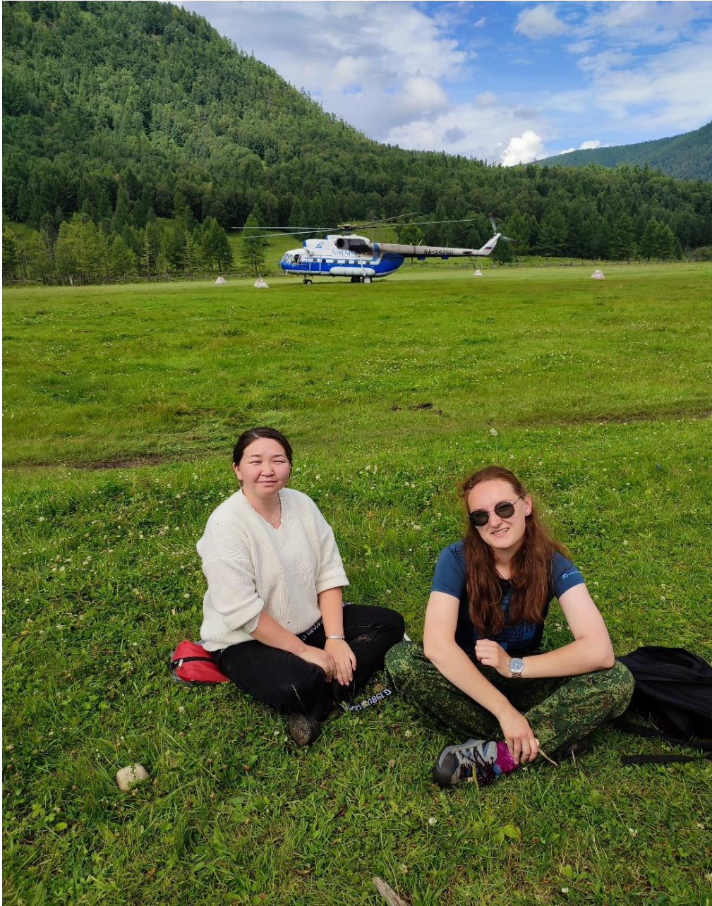
Рис. 1. с. Верхняя Гутара, аэропорт. Вертолет – основное транспортное средство

муниципальном образовании проживает большая часть КМН. Согласно статистическим данным и социологическим этнографическим исследованиям, проведенным ранее Кривоноговым В.П. и Рагулиной М.В. «чистокровных» представителей тофаларов почти не осталось. Возрастно-половой состав свидетельствует о демографической деградации поселения. Наибольшую долю проживающих составляют пенсионеры и дети до 14 лет. [6,9]. На территории Верхнегутарского муниципального образования зарегистрировано три малочисленные общины «Ирбис», «Тагул», «Кедр». Население ведет оседлый образ жизни. Миграция населения не превышает 2% в год.