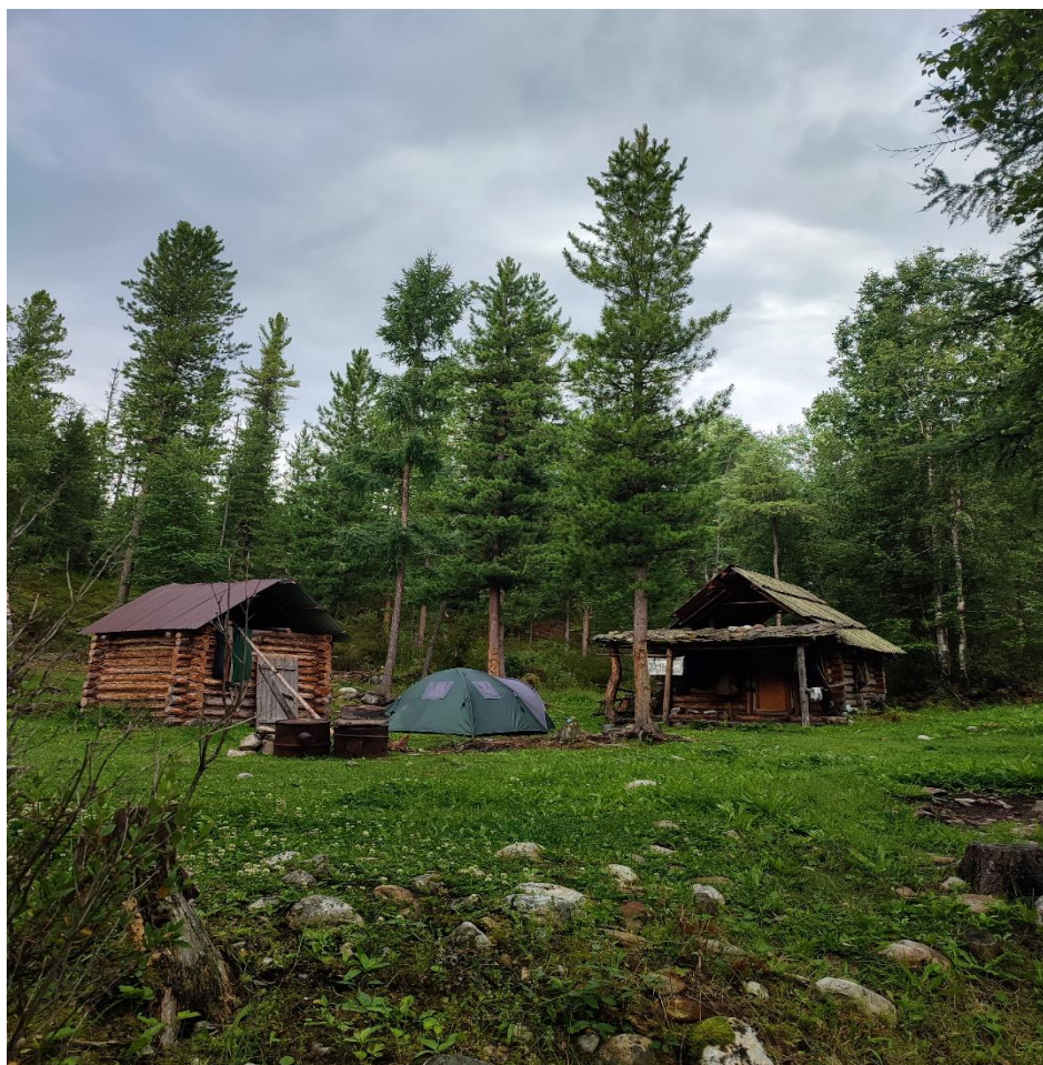
Рис.3. Охотничья изба, в 20 км от с. В. Гутара, вверх по течению реки Гутара

Для того чтобы выявить готовность населения к развитию рекреационного потенциала местности, среди местных жителей был проведён рандомизированный социологический опрос. Основной целью которого является определение заинтересованности и готовности местного населения в развитии туристского бизнеса.