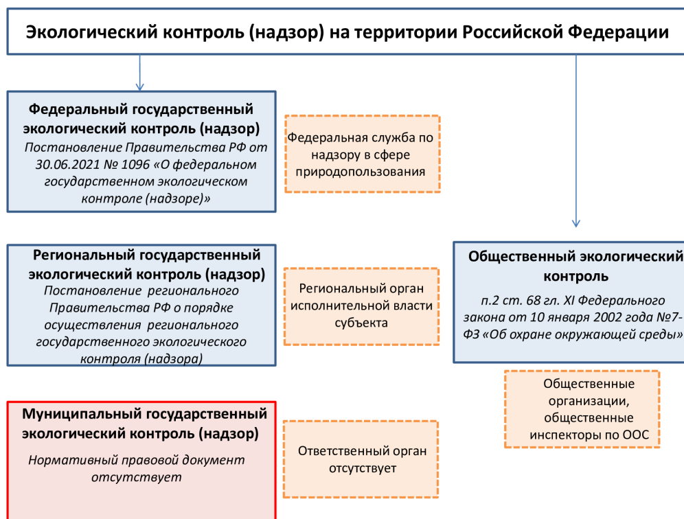
Рис. 3. Система территориального экологического надзора в Тюменской области Составлено авторами