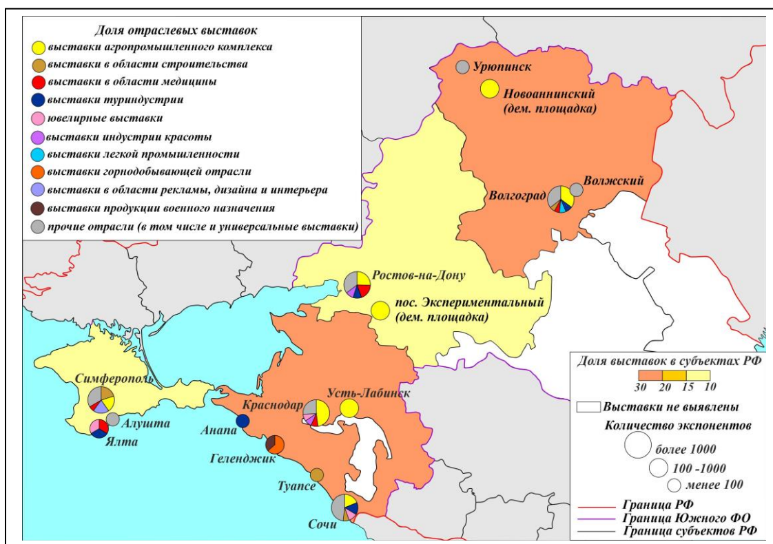
Рис. 1. География отраслевой выставочной деятельности в Южном ФО Составлено автором

Подводя итог, можно сказать, что отраслевая структура выставочной деятельности в Южном ФО отличается большим разнообразием, причем количество выставок в той или иной отрасли не всегда говорит о значимости данного направления. Особенно это заметно в промышленных выставках. Отраслевая структура значительно отличается и по субъектам РФ в ЮФО. Такие направления как АПК, туриндустрия, медицина, строительство, ювелирная отрасль встречаются во всех субъектах РФ округа, где выявлены выставки, что говорит о важности этих направлений в выставочной деятельности ЮФО. Некоторые же направления (ОПК, легкая промышленность, зооиндустрия, экология и др.), в основном в промышленности и сфере услуг, встречаются только в отдельных субъектах РФ (рис.1).