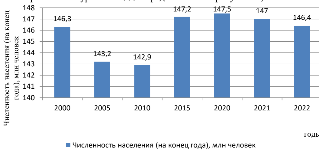
Рис.1. Численность населения Российской Федерации, млн чел. Составлено автором по [4,8]

Численность населения (на конец года), млн чел. выросла на 100 тыс.чел. в 2022г.по сравнению с уровнем 2000 г.представлено на рисунках 1, 2.