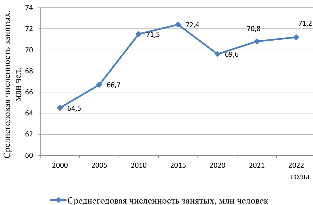
Рис.3. Среднегодовая численность занятых Российской Федерации, млн чел. Составлено автором по [8]

Среднегодовая численность занятых, увеличилась на 6,7 млн чел. в 2022 г. по сравнению с уровнем 2000 г. как показана динамика на рисунке 3 в динамике.