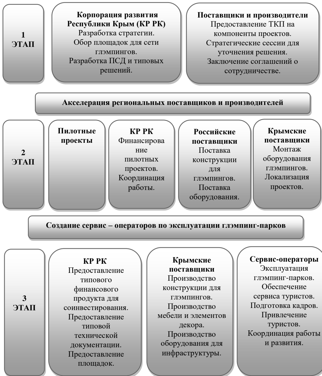
Рис. 2. Дорожная карта реализации концепции развития глэмпинг-туризма в РК Составлено авторами