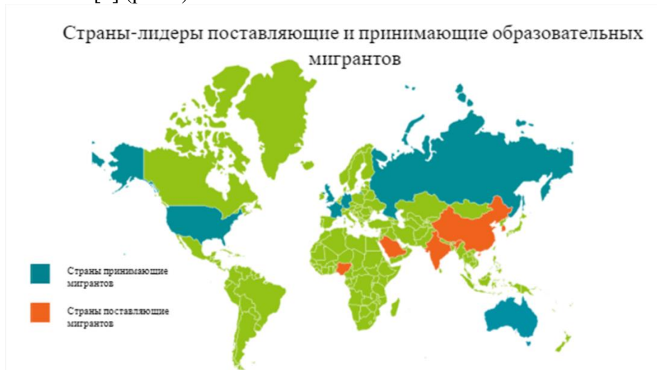
Рис. 1. Страны-лидеры, поставляющие и принимающие образовательных мигрантов, 2021 г.

Основными поставщиками учебных мигрантов являются Китай, Индия, Республика Корея, Нигерия, Франция, Саудовская Аравия и некоторые страны Центральной Азии [6] (рис.1).