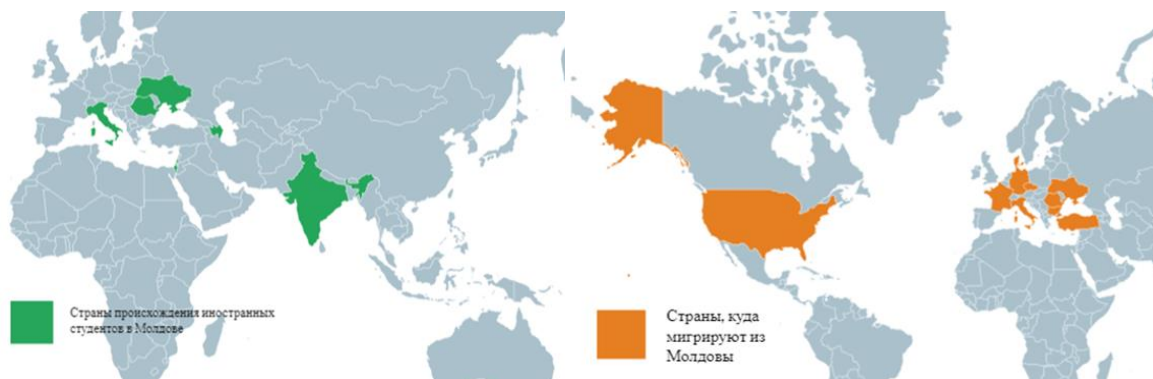
Рис. 2. Страны, из которых приезжают студенты в Молдову, 2021г.

В Молдове исходящие потоки превышают входящие потоки почти в 3 раза. Для получения высшего образования в Молдову приезжают студенты из Румынии, Израиля, Индии, Украины, Турции, Азербайджана, Италии и т.д. (рис.2). Причем, количество абитуриентов из Румынии составляет чуть более половины общего числа образовательных мигрантов. На это влияет, возможно, общий язык общения и обучения, сравнительно дешевое обучение.